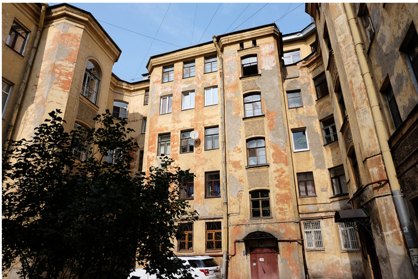
Четыре интересных факта о доме на улице